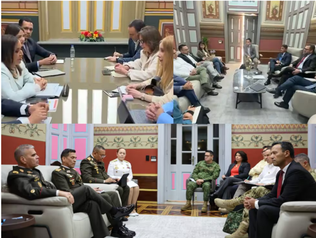
El encuentro entre varios miembros del gabinete colombiano y venezolano ocurrió luego de la sorpresiva cancelación del encuentro entre los presidentes Gustavo Petro y Delcy Rodríguez.

El encuentro entre varios miembros del gabinete colombiano y venezolano ocurrió luego de la sorpresiva cancelación del encuentro entre los presidentes Gustavo Petro y Delcy Rodríguez.