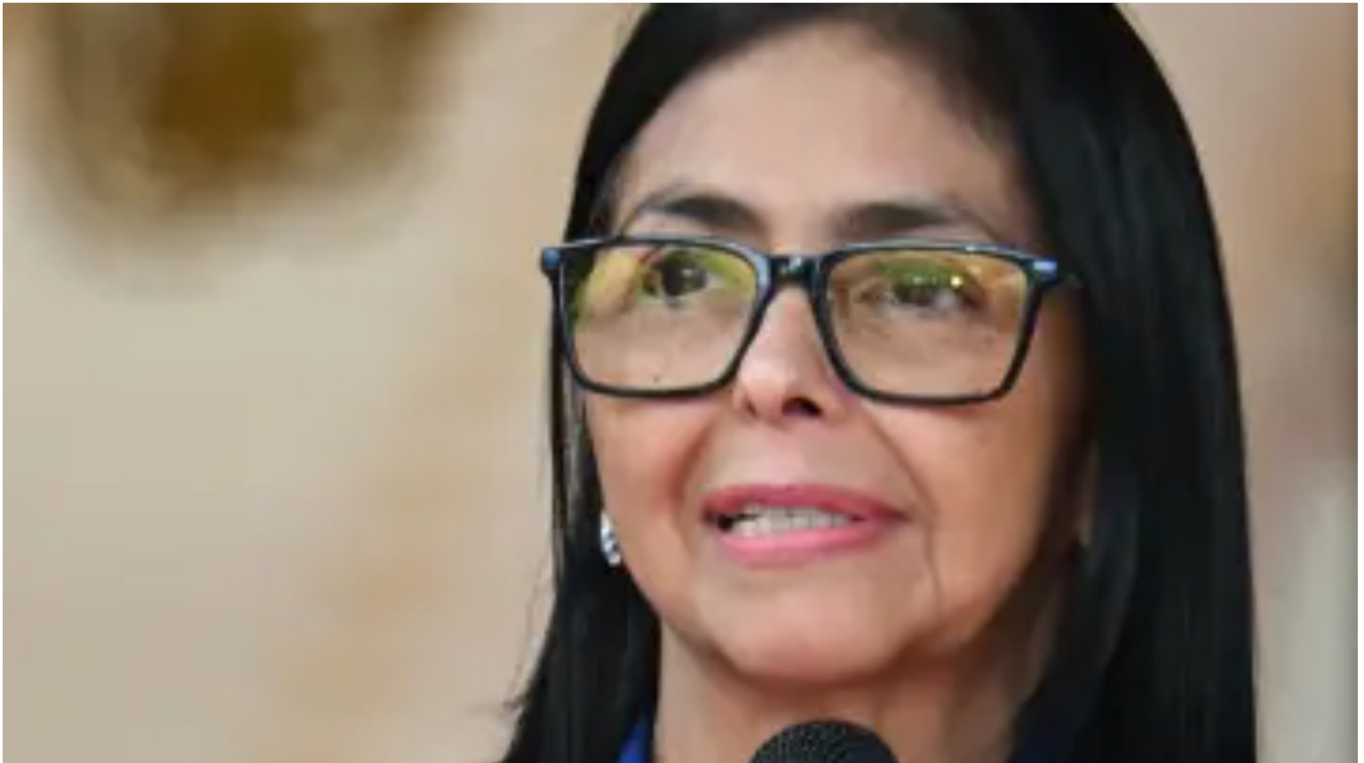
Delcy Rodríguez

La mesa energética contó con la participación del ministro colombiano de Minas y Energía, Edwin Palma, acompañado del presidente de la petrolera estatal Ecopetrol , Ricardo Roa.