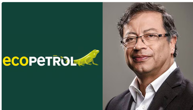
El presidente Gustavo Petro habló del camino que debe tomar Ecopetrol.

Este jueves 12 de marzo, el presidente de la República, Gustavo Petro, publicó un mensaje en sus redes sociales, en el que dio una serie de directrices sobre Ecopetrol .