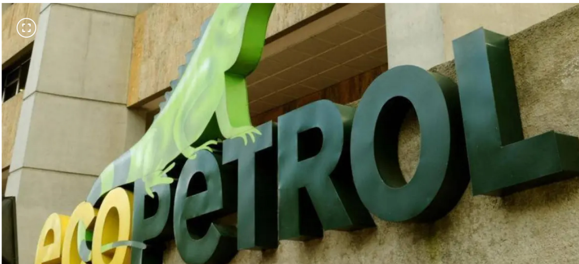
Junta Directiva de Ecopetrol respalda a Ricardo Roa ante proceso en la Fiscalía.

La alta gerencia mencionó que respeta la presunción de inocencia de Ricardo Roa y su derecho al debido proceso.