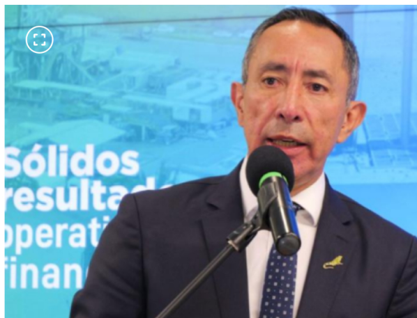
Ricardo Roa, presidente de Ecopetrol se declaró inocente en la primera imputación de cargos.

Ambos procesos avanzan de manera independiente dentro de las investigaciones que adelanta la Fiscalía.