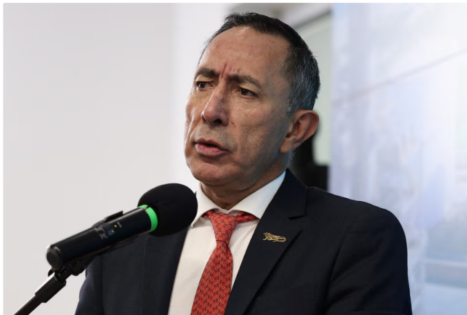
El presidente del grupo energético colombiano Ecopetrol, Ricardo Roa, se mantendrá en el cargo pese a las investigaciones

Uno de los puntos destacados fue el compromiso de mantener un monitoreo permanente de la información financiera de la compañía. El órgano máximo de dirección expresó que deliberará hasta adoptar una decisión formal sobre la compatibilidad de la continuidad de Ricardo Roa con las obligaciones regulatorias de la empresa. La prioridad es realizar los correctivos necesarios sobre las consecuencias que pueda causar la investigación a Roa.