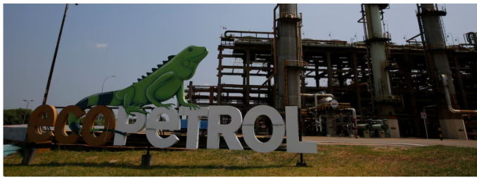
La junta de Ecopetrol anuncia seguimiento al impacto financiero y revisa la continuidad de su presidente

Tras una sesión universal realizada luego de la audiencia judicial en el Juzgado 35 de Control de Garantías de Bogotá, la junta directiva de Ecopetrol puso en marcha mecanismos de evaluación objetiva y documentada. Los directores reportaron contar con información suministrada tanto por la administración de la empresa como por firmas de consultoría nacionales e internacionales especializadas, para completar el análisis de los posibles impactos.