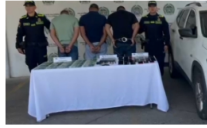
Capturas por presuntos delitos electorales en Barrancabermeja