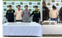
Capturan a tres presuntos expendedores de "Los de la M"