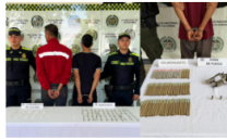
Capturan a tres personas por microtráfico en la ciudad