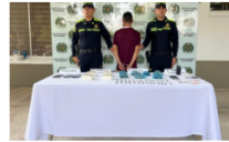
Capturan a alias "El Paisa" presunto integrante de "Los de la M"