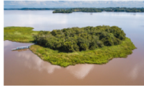
Avanza la protección de la Ciénaga San Silvestre en Barrancabermeja