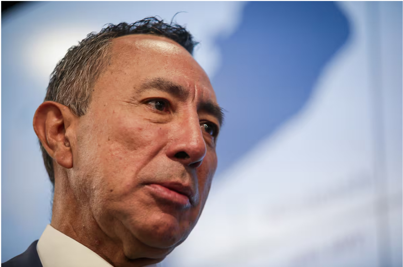
El presidente de Ecopetrol, Ricardo Roa Barragán.

Siga las noticias de El Universal en Google Discover