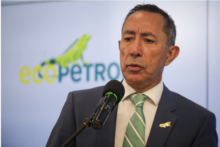
El presidente de Ecopetrol, Ricardo Roa Barragán.

Posteriormente, entre septiembre y octubre de ese mismo año, se habría llevado a cabo un segundo encuentro privado dentro de instalaciones de Ecopetrol.