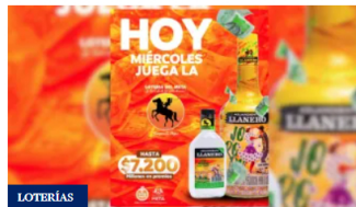
Lotería del Meta: resultados completos del 11 de marzo de 2026