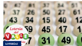
Lotería del Valle HOY 11 de marzo 2026: resultados premio mayor y secos