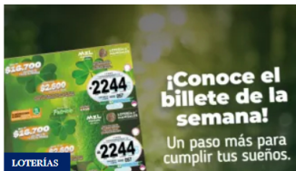
Lotería de Manizales: resultados completos del 11 de marzo de 2026