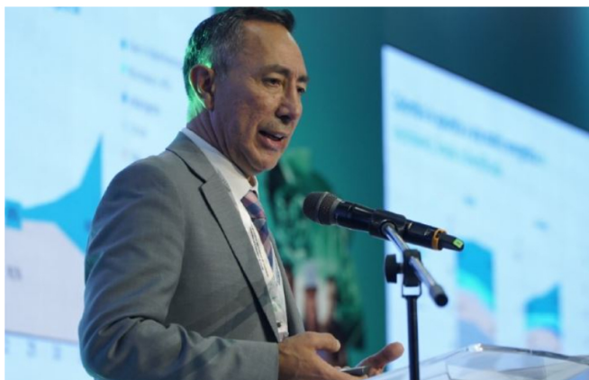
Las acusaciones contra Ricardo Roa, presidente de Ecopetrol, pueden afectar la imagen corporativa de la estatal.

La Fiscalía lo acusó de tráfico de influencias por el negocio de un apartamento, situación que puede afectar la imagen de la compañía. Sin embargo, al cierre de esta edición no se conocía la postura de la junta directiva