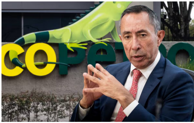
Ricardo Roa en la sede de Ecopetrol, en Bogotá, Colombia, el 1 de abril.

Lea también: “La empresa va por buen camino”: Ricardo Roa tras caída de utilidades de Ecopetrol