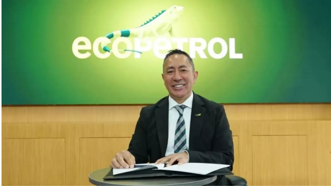
Créditos: Ricardo Roa, presidente de Ecopetrol. Imagen tomada de Ecopetrol

Hoy otra imputación contra el funcionario por presunta violación de topes de campaña Petro.