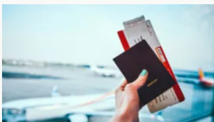
Estados Unidos, México y España lideraron la compra de tiquetes aéreos hacia Colombia en 2025