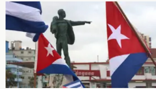
Cuba anunciará la excarcelación de 51 presos en acuerdo con el Vaticano