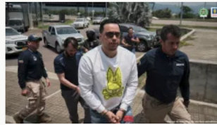
Condenan a 26 años de prisión a alias 'Castor', líder de 'Los Costeños'