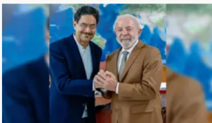
Iván Cepeda se reúne con Lula Da Silva en medio de su campaña presidencial