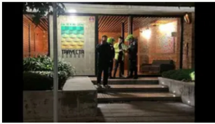
Intercambio de disparos y robo de moto BMW en el norte de Bogotá