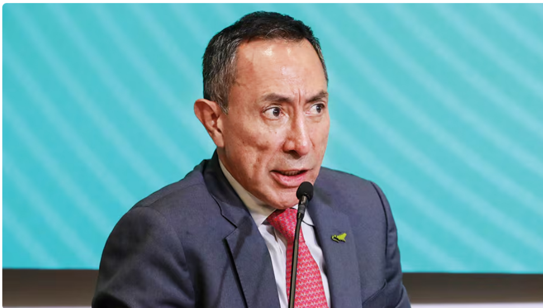
La Fiscalía General le imputó el delito de tráfico de influencias al presidente de Ecopetrol , Ricardo Roa.

La Fiscalía General le imputó este miércoles, 11 de marzo , el delito de tráfico de influencias al presidente de Ecopetrol, Ricardo Roa Barragán .