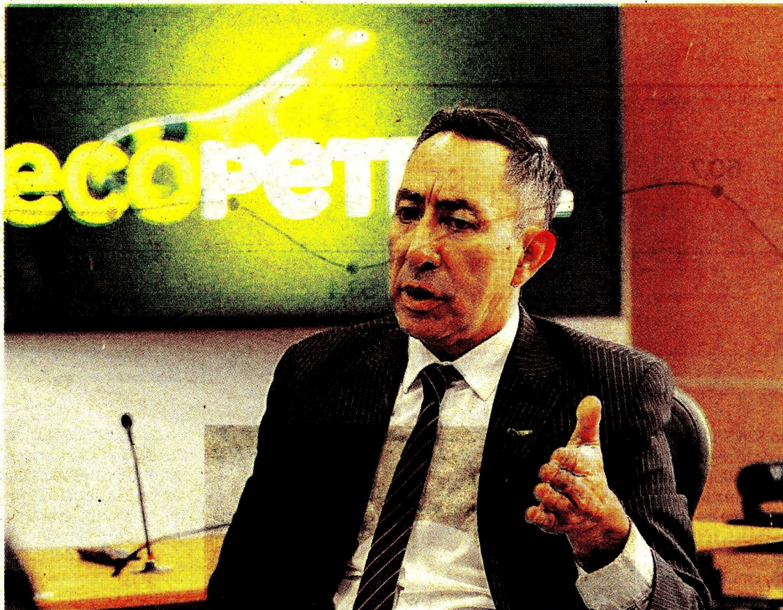
Ricardo Roa, presidente de Ecopetrol está bajo la lupa de la Fiscalía.

El caso contra el presidente de Ecopetrol se originó a partir de una investigación periodística publicada por el diario El Tiempo en diciembre de 2023, que reveló detalles sobre la negociación del apartamento relacionado con el empresario Serafino Iacono. En ese momento se die-