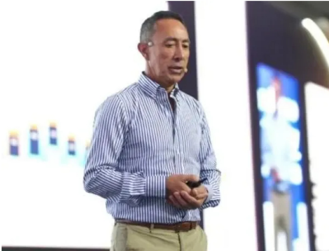
Ricardo Roa, presidente de Ecopetrol .

El caso contra el presidente de Ecopetrol se originó a partir de una investigación periodística publicada por el diario El Tiempo en diciembre de 2023, que reveló detalles sobre la negociación del apartamento relacionado con el empresario Serafino Iacono. En ese momento se dieron a conocer los vínculos entre la operación inmobiliaria y distintos actores empresariales.