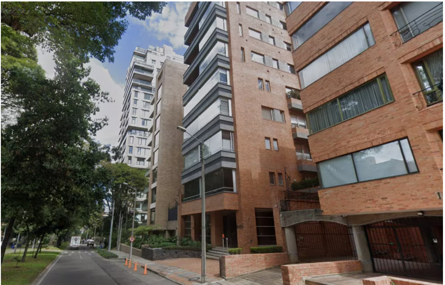
Este sería el edificio en el que se encuentra el apartamento en cuestión