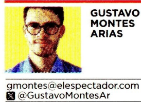
GUSTAVO MONTES ARIAS

El proceso penal contra el presidente de Ecopetrol está relacionado con la compra de un lujoso apartamento al norte de Bogotá y un posible direccionamiento indebido de contratos. Este jueves tendrá una segunda imputación por otro caso.