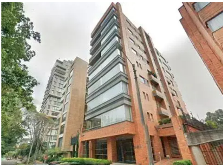
El apartamento le habría costado a Ricardo Roa 1.800 millones de pesos.

En términos simples, el apartamento se vendió muy por debajo de su precio real. La diferencia fue de aproximadamente $927 millones, lo que equivale a un descuento cercano al 34% frente al valor de mercado.