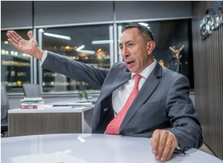
Ricardo Roa, presidente de Ecopetrol , imputado por tráfico de influencias.

Según la investigación, la transacción pudo constituir un uso indebido de la posición de Roa, como presidente de Ecopetrol , para favorecer intereses particulares.