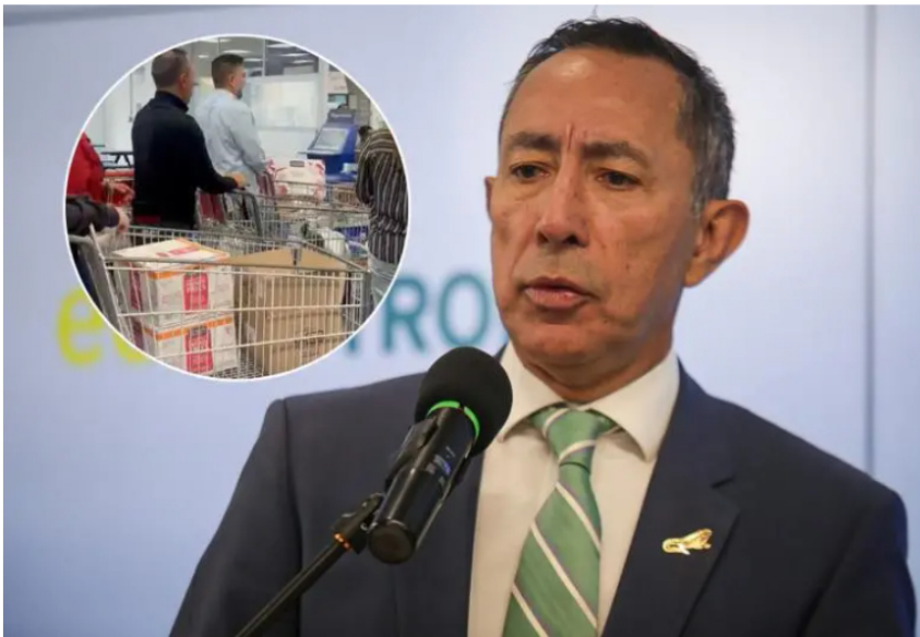
Ricardo Roa, presidente de Ecopetrol, vivió momentos de rechazo en un supermercado en Bogotá.

El funcionario del gobierno de Gustavo Petro enfrenta acusaciones por presunto tráfico de influencias y una imputación por violación de topes electorales.