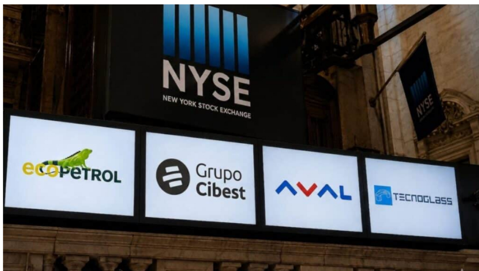
Foto: Ecopetrol , Cibest, Grupo Aval y Tecnoglass, las empresas que cotizan en bolsas de EE. UU.