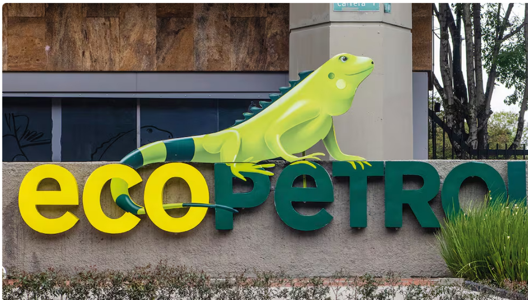
La decisión del Gobierno de no avanzar en nuevos contratos de exploración y el rompimiento del gobierno corporativo de la compañía han afectado los indicadores de Ecopetrol .

En esta década, Ecopetrol avanzó en un proceso de transformación, anticipándose a la transición energética que venía. La primera gran movida fue en 2021, con la compra de más del 51 por ciento de ISA, para incorporar a su portafolio negocios como los de transmisión de energía, concesiones viales y comunicaciones.