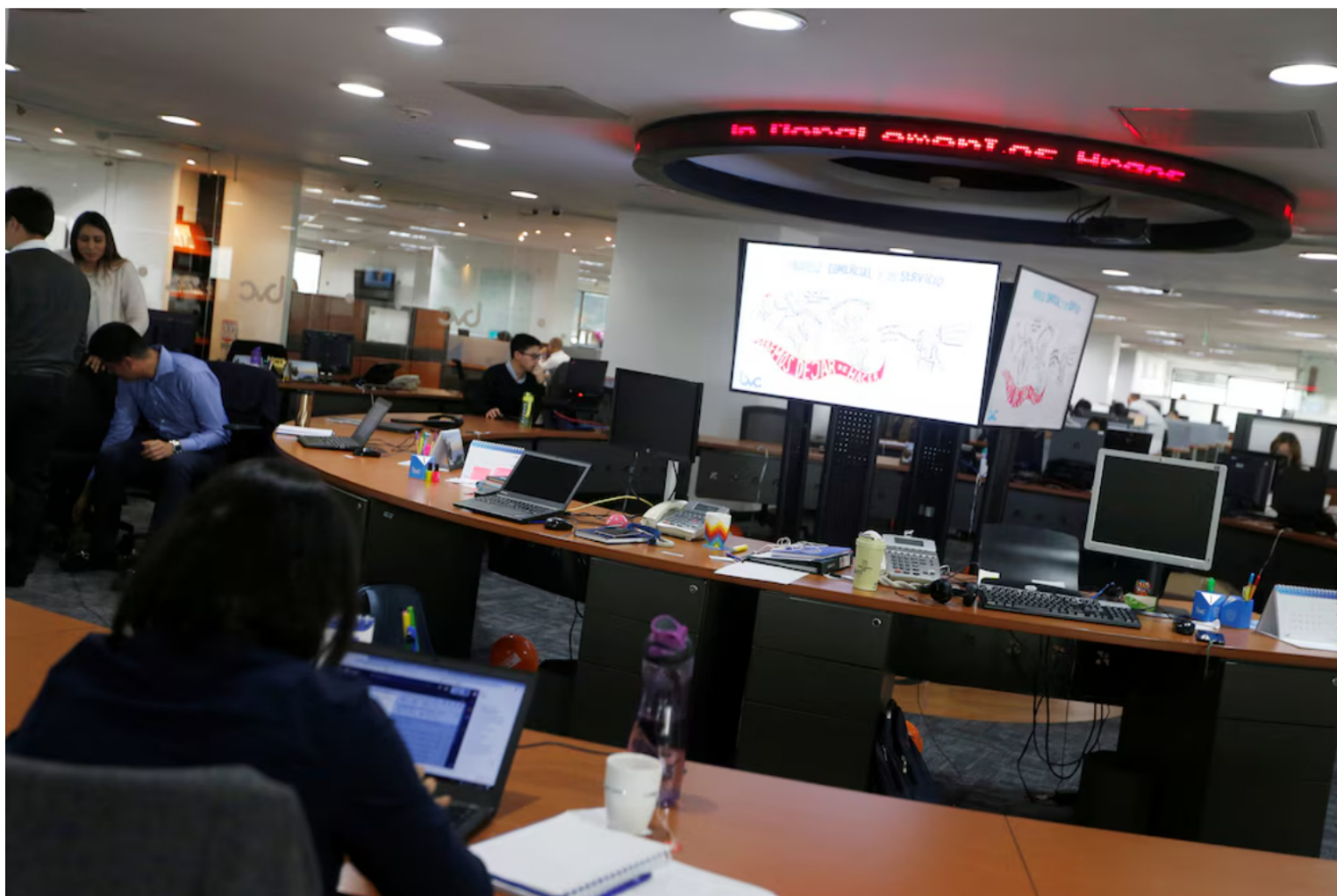
La Bolsa de Valores de Colombia (bvc) es la principal institución financiera y bursátil del país

La docente sumó otros factores de oferta y demanda. Mencionó más bombeo de productores del Golfo como Kuwait y Adnoc, una previsión de consumo global más débil en 2026 de la Agencia Internacional de Energía (EIA) y un recorte en la previsión de la misma, aunque advirtió que cualquier rebrote en Medio Oriente puede devolver el barril a la parte alta del rango.