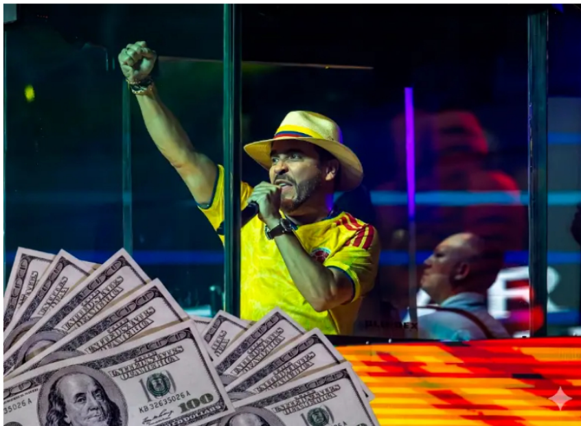
La acción de Ecopetrol lideró las pérdidas de la jornada bursátil con una caída de 8,85%, en medio de la reacción del mercado a las elecciones presidenciales. FOTO

El MSCI Colcap cayó 2,64% y Ecopetrol se hundió 8,2%, mientras el dólar bajó a niveles no vistos desde 2020 tras las elecciones.