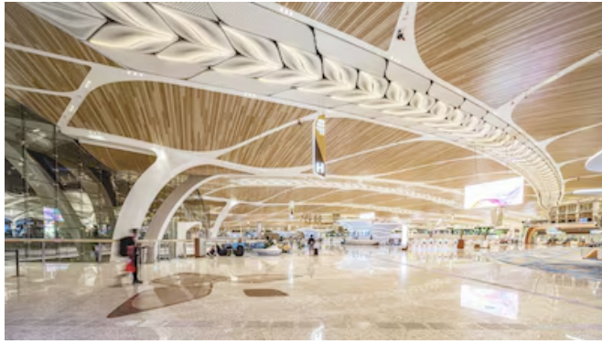
Los aeropuertos más bellos del mundo en 2026: la lista de Prix Versailles