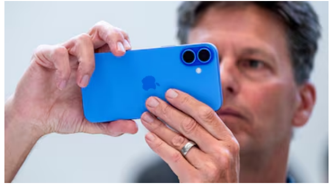
Tim Cook ve “inevitable” un aumento de precios en los productos Apple