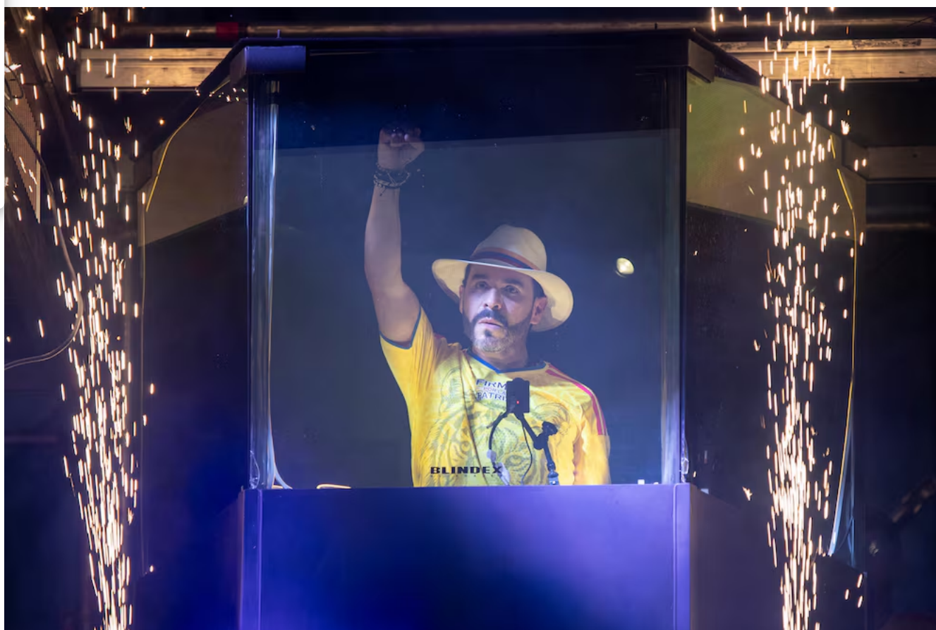
Abelardo de la EsPriella permanece tras un cristal antibalas en el escenario durante un mitin de cierre de campaña en Buga el 14 de junio.

Entre los movimientos más destacados aparecía Ecopetrol ( EC ), que avanzaba cerca de 9,41% en las negociaciones nocturnas. El Grupo Cibest ( CIB ), matriz de Bancolombia, registraba una subida de 6,7%, mientras que el ETF Global X MSCI Colombia, uno de los principales vehículos utilizados por inversionistas internacionales para exponerse al mercado colombiano, ganaba alrededor de 5,42%.