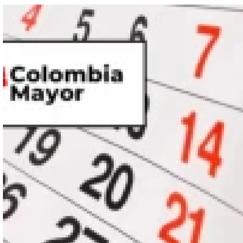
Consultar adulto mayor por cédula 2026: verifica si eres beneficiario en Prosperidad Social