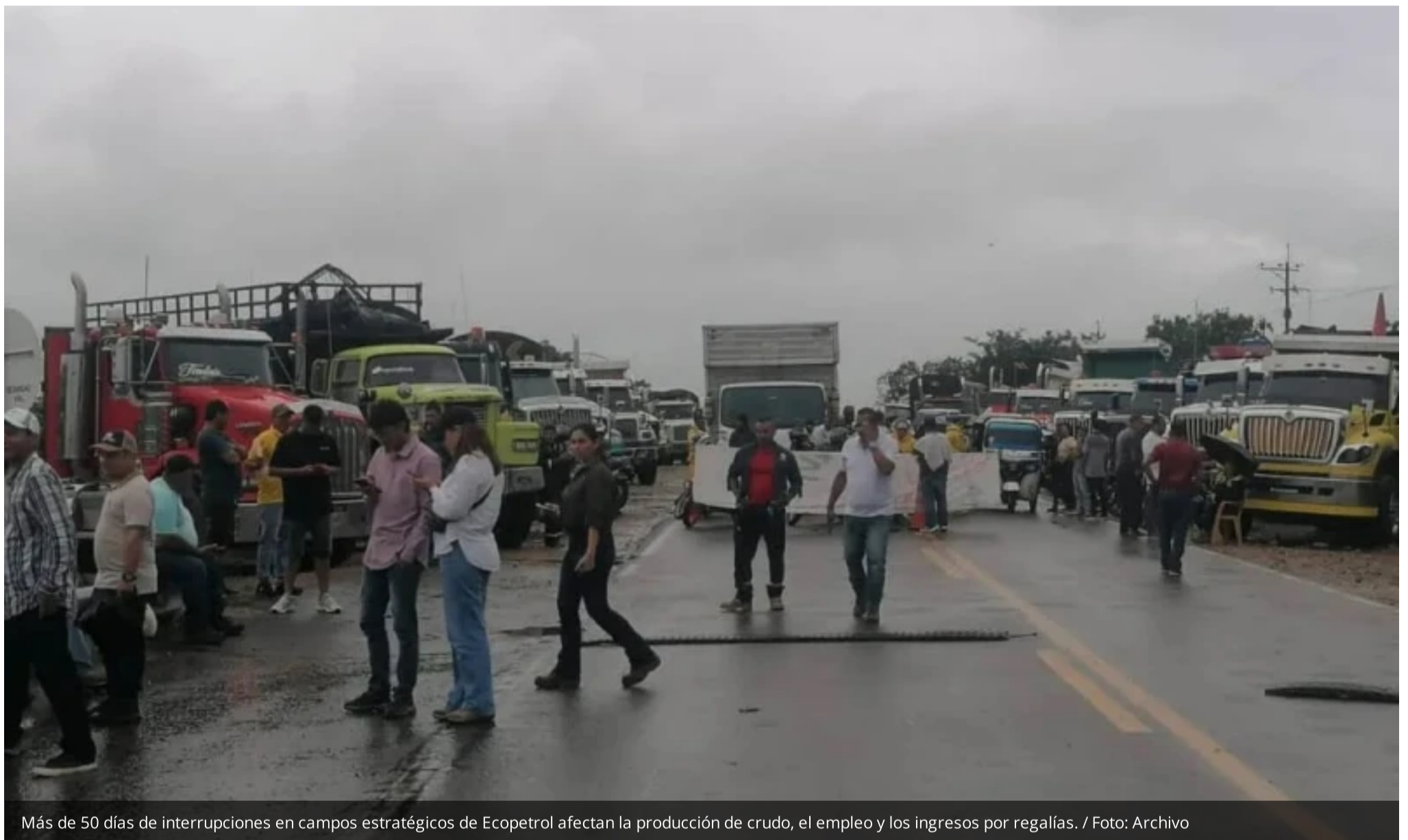
Más de 50 días de interrupciones en campos estratégicos de Ecopetrol afectan la producción de crudo, el empleo y los ingresos por regalías.

Bogotá – La producción petrolera de Colombia enfrenta una nueva presión. Ecopetrol informó que los bloqueos que afectan operaciones en el departamento del Meta han impedido la extracción de más de 800.000 barriles de petróleo en los últimos 52 días, generando pérdidas económicas y aumentando las preocupaciones sobre el futuro de la producción nacional de hidrocarburos.