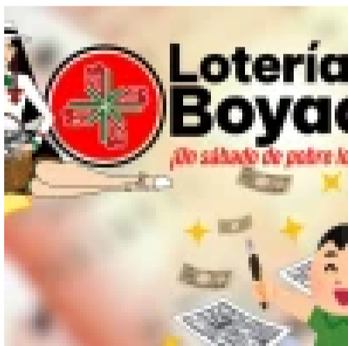
Lotería Boyacá: resultados del último sorteo hoy sábado 20 de junio de 2026