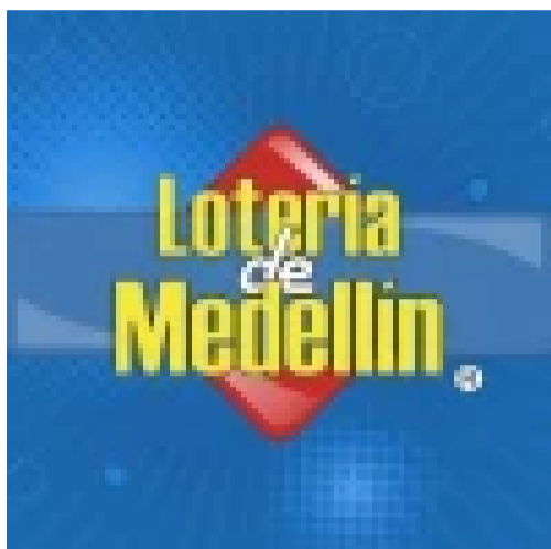
Resultados Lotería de Medellín 19 de junio: quién ganó el premio mayor