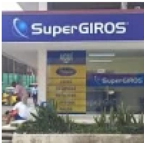
SuperGIROS adulto mayor: cómo consultar con cédula si ya llegó tu giro de Colombia Mayor