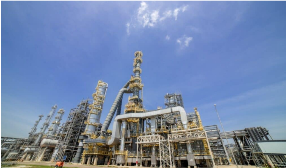
Desarrollo de combustibles SAF en Reficar.

De acuerdo con la compañía, durante los próximos dos años se adelantarán análisis técnicos para evaluar la viabilidad de la iniciativa. El proyecto podría apoyarse en la infraestructura del Proyecto Coral, que actualmente se desarrolla en la Refinería de Cartagena (Reficar) . Esta infraestructura tendría una capacidad de producción de aproximadamente 800 toneladas anuales de hidrógeno verde, insumo clave para la elaboración de combustibles sintéticos de bajas emisiones.