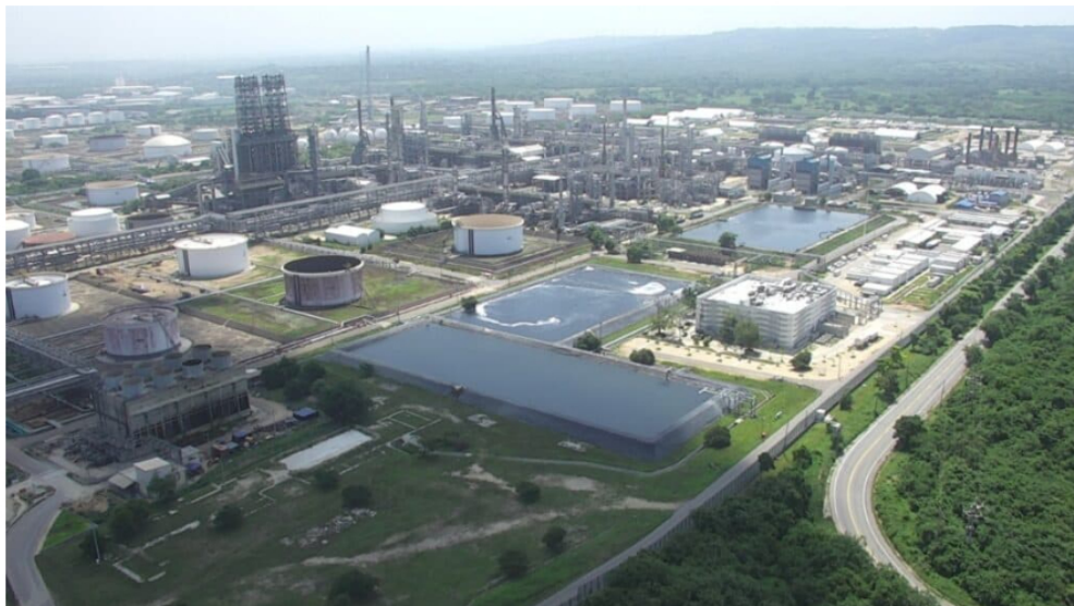
Desarrollo de combustibles SAF en Reficar.

Por: Manuel Alejandro Correa - 2026-06-19