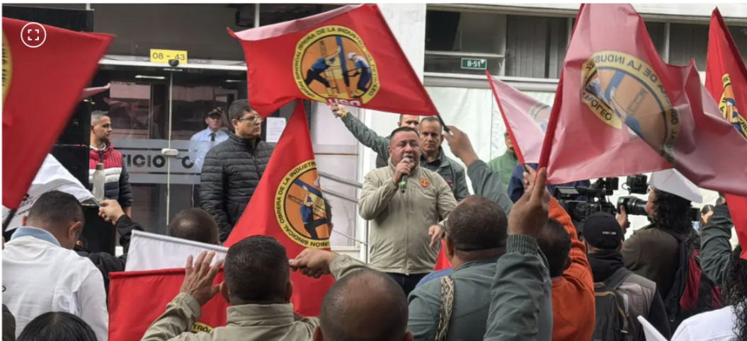
USO sindicato de Ecopetrol

El sindicato plantea reactivar exploración, elevar producción y financiar la transición con más hidrocarburos.