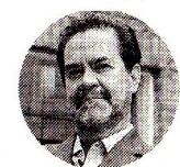
Frank Pearl Presidente de la ACP

“Con los niveles actuales de actividad exploratoria será cada vez más difícil sostener la producción en 750.000 barriles y los ingresos que el sector genera para la Nación”.