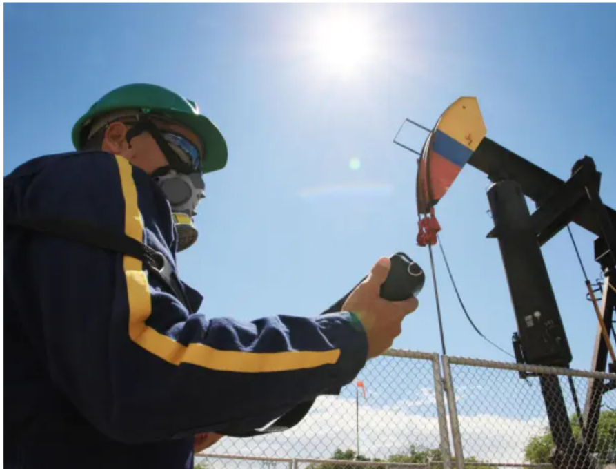
Ecopetrol presentó su balance financiero correspondiente al trimestre julio- septiembre.

El funcionario indicó que ha recibido mensajes de apoyo de personas vinculadas al sector energético dentro y fuera del país, quienes conocían su trayectoria en la industria.