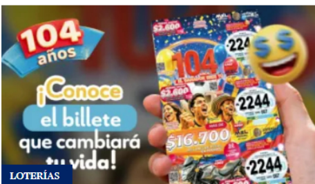
Resultados de la Lotería de Manizales hoy 17 de junio de 2026