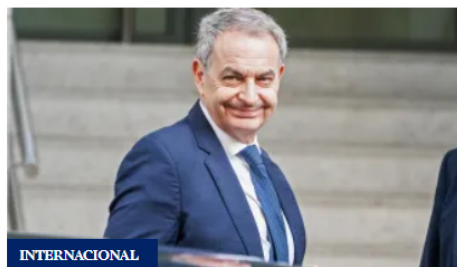
Zapatero niega gestiones para Plus Ultra y no habla de las joyas