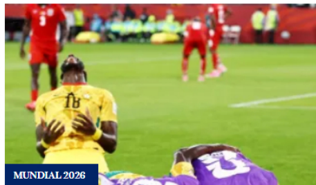
Panamá cae 1-0 ante Ghana en su debut en el Mundial 2026