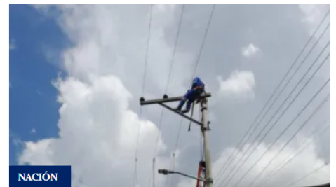
Bogotá, Chía y Soacha tendrán cortes de luz este 18 de junio de 2026