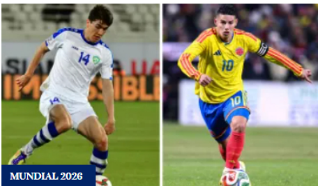
Colombia vs. Uzbekistán: siga el debut de los cafeteros en el Mundial 2026