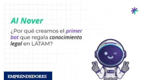
AI Nover: el primer BOT que regala conocimiento legal en Latinoamérica