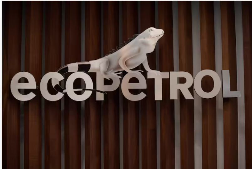
Logo de esta empresa petrolera de Colombia.