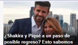
¿Shakira y Piqué a un paso de posible regreso? Esto sabemos