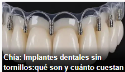
Chía: Implantes dentales sin tornillos: qué son y cuánto cuestan