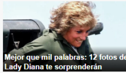
Mejor que mil palabras: 12 fotos de Lady Diana te sorprenderán