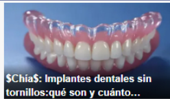
¡Chía!: Implantes dentales sin tornillos: qué son y cuánto...