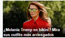
¿Melania Trump en bikini? Mira sus outfits más arriesgados