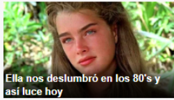
Ella nos deslumbró en los 80's y así luce hoy