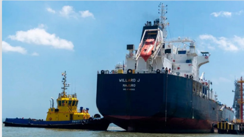
Este es el buque cisterna Willard, que transporta el combustible desde la Refinería de Cartagena hasta el puerto de Tumaco, en el Pacífico colombiano.

E l Gobierno de las Oportunidades continúa consolidando la estrategia de protección a las poblaciones del suroccidente colombiano, y para este fin garantizó el suministro de combustible para al desarrollo regional.