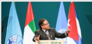
“Teníamos que bajar la temperatura a 1.5 y Naciones Unidas...”