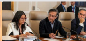
Presidente Petro ordena ‘actuar de inmediato’ frente a demanda de la FPM