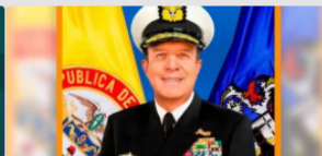
Almirante Francisco Cubides asumirá el Comando General de la Armada Nacional