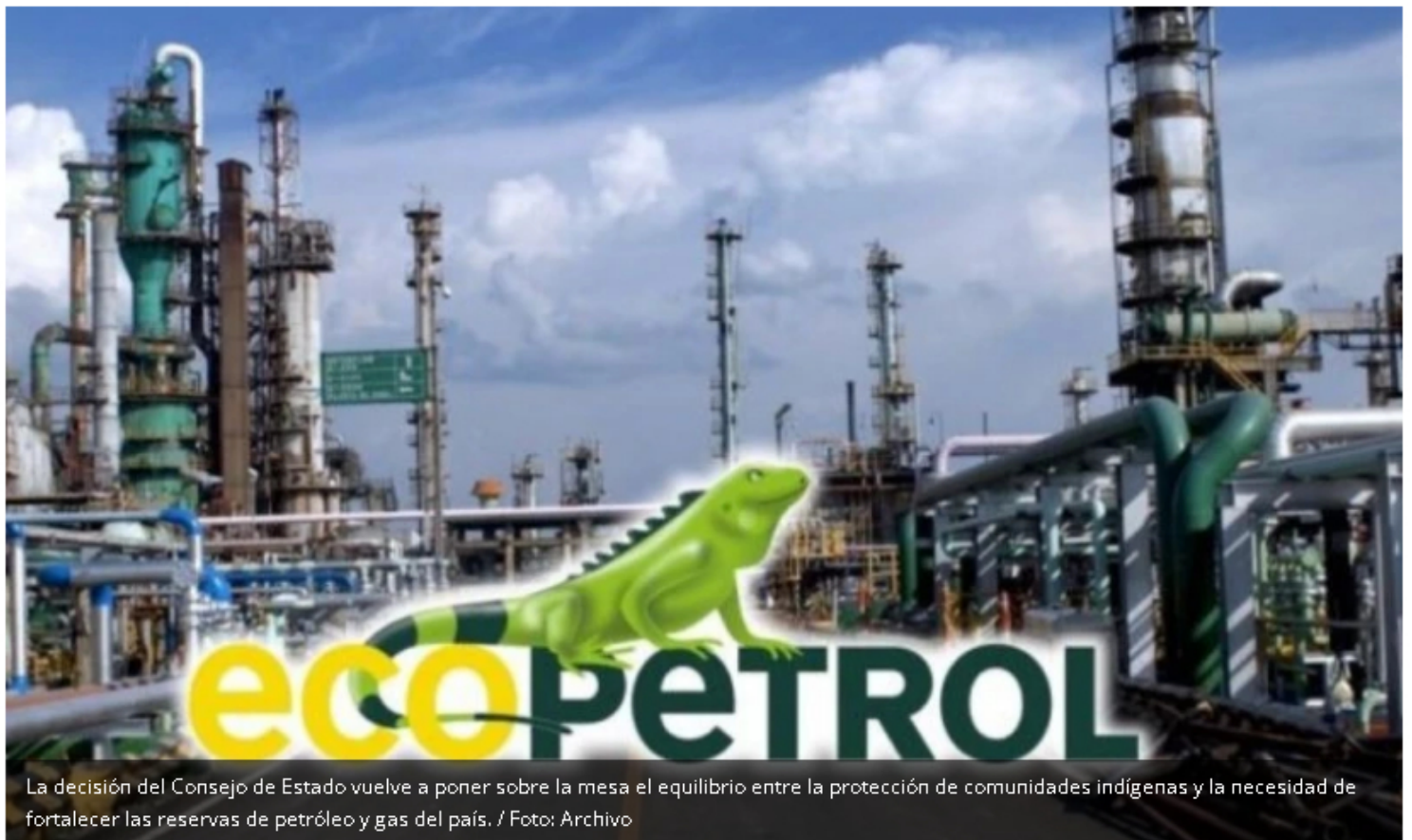
La decisión del Consejo de Estado vuelve a poner sobre la mesa el equilibrio entre la protección de comunidades indígenas y la necesidad de fortalecer las reservas de petróleo y gas del país.

Bogotá - El Consejo de Estado dejó sin efectos la licencia ambiental que permitía a Ecopetrol desarrollar el Área de Perforación Exploratoria (APE) Magallanes, ubicada en el municipio de Toledo, Norte de Santander, al concluir que durante el proceso de licenciamiento no se realizó la consulta previa con el pueblo indígena u'wa.