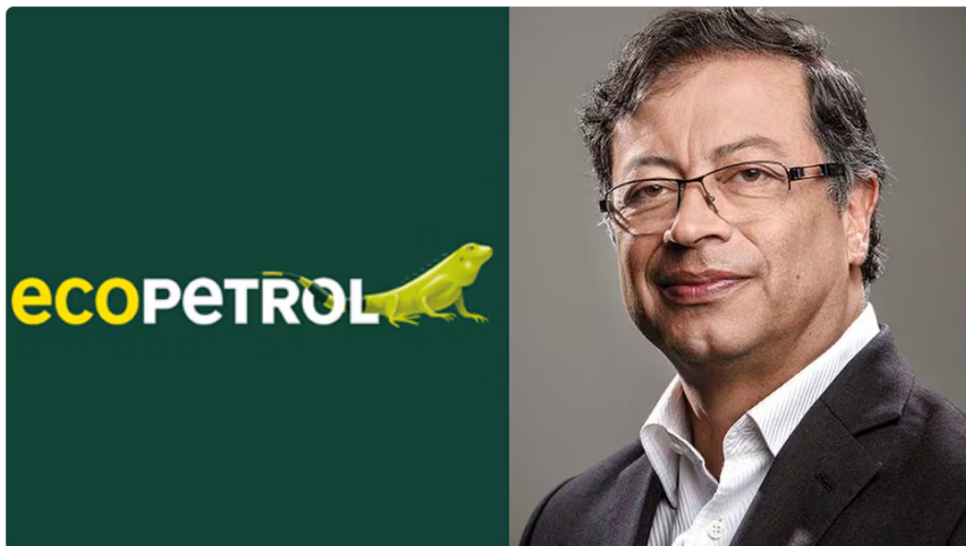
El presidente analizó las inversiones de Ecopetrol .

El presidente Gustavo Petro lanzó nuevas advertencias sobre la situación financiera de Ecopetrol y el manejo de la deuda pública del país, al asegurar que la petrolera estatal estaría sosteniendo su inversión en Permian mediante créditos que podrían representar riesgos para las finanzas nacionales.