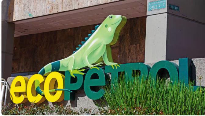
Petro señaló que los créditos podrían volverse deuda para la Nación.

Petro señaló que esas obligaciones son asumidas inicialmente por la compañía, pero advirtió que eventualmente podrían convertirse en una carga para la Nación.