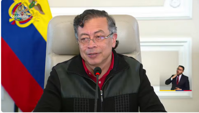
Gustavo Petro, presidente de Colombia.

Las afirmaciones del presidente se producen en medio del debate sobre la sostenibilidad fiscal del país, el papel de Ecopetrol en la economía nacional y las decisiones relacionadas con la gestión de la deuda pública en los próximos años.