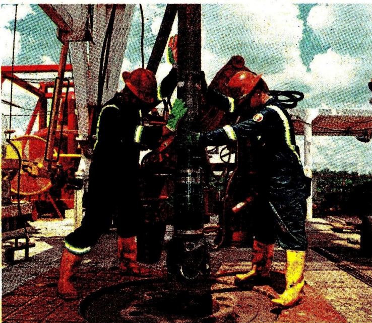
Colombia produce un poco más 700.000 barriles diarios.

tégico en términos de producción?”, señaló el economista jefe de Corficolombiana.