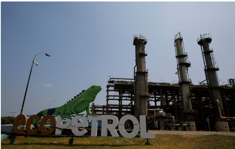
Ecopetrol es el gran afectado con los bloqueos en el Meta

Los bloqueos limitaron el despacho de bienes y restringieron el movimiento de personal crítico para las operaciones regionales. La ACP señaló que la situación persiste desde el 5 de junio, con afectaciones directas en Puerto Gaitán y consecuencias para comunidades y contratistas del sector.