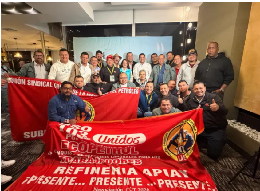
Con estos cinco puntos acordados, ambas partes dan por terminado el proceso de negociación.

En un pronunciamiento oficial, el sindicato señaló que se logró un “acuerdo definitivo con la administración de Ecopetrol S.A.” y afirmó que el resultado constituye un “hito histórico para el movimiento sindical colombiano” .