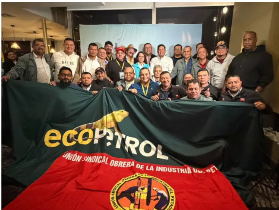
La negociación concluyó hacia las 4:50 a. m. del 13 de junio tras varias semanas de diálogo.

La USO informó que el acuerdo se alcanzó en la madrugada del 13 de junio tras varias semanas de negociación y contempla medidas sobre estabilidad laboral, contratistas, salarios, desarrollo regional y progresividad laboral.