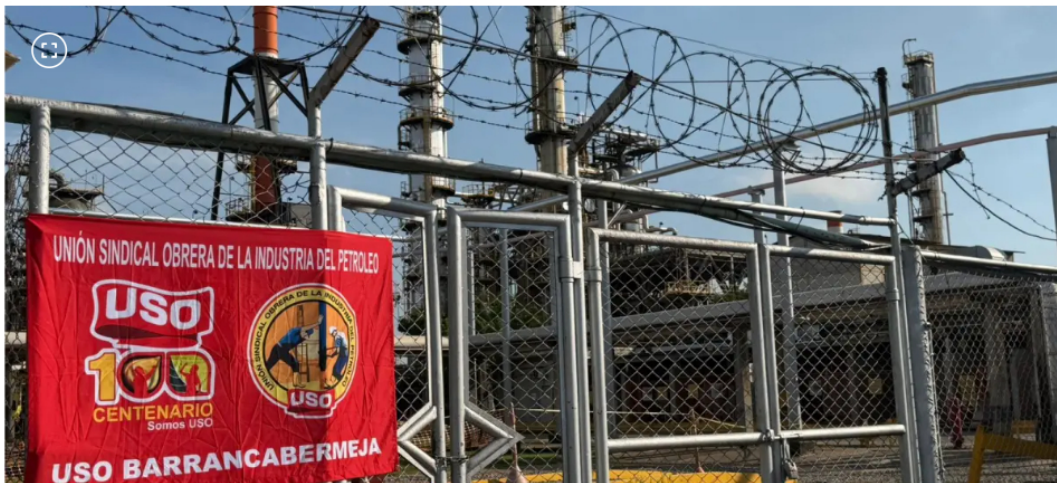
Los trabajadores de la USO piden acciones urgentes para superar el paro.

La organización convocó a dirigentes, delegados y afiliados a escenarios de protesta en todo el país.