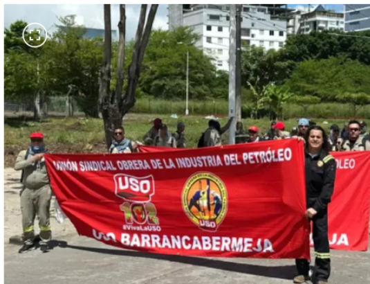
Manifestaciones de la USO

La negociación se desarrolla en torno a la nueva Convención Colectiva de Trabajo . La USO sostiene que su objetivo es garantizar condiciones dignas para trabajadores de nómina directa, trabajadores tercerizados y comunidades relacionadas con la actividad de Ecopetrol.