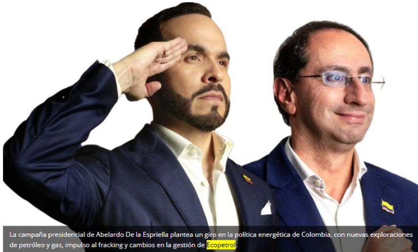
La campaña presidencial de Abelardo De la Espriella plantea un giro en la política energética de Colombia, con nuevas exploraciones de petróleo y gas, impulso al fracking y cambios en la gestión de Ecopetrol .

Bogotá – En una entrevista con Valora Analitik , la fórmula presidencial de Abelardo De la Espriella anunció una serie de medidas orientadas a fortalecer la producción de hidrocarburos y garantizar la seguridad energética de Colombia. José Manuel Restrepo, candidato a la Vicepresidencia y exministro de Hacienda, aseguró que un eventual gobierno impulsaría la reactivación de nuevos contratos de exploración de petróleo y gas desde el inicio de su mandato.