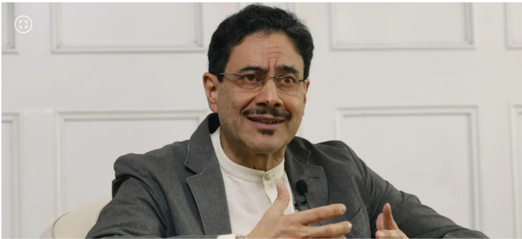
El senador y candidato a la Presidencia de Colombia por el partido Pacto Histórico, Iván Cepeda.

El candidato por el Pacto Histórico prefirió no pronunciarse sobre si Roa continuaría o no en el cargo.