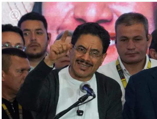
Iván Cepeda, candidato presidencial del Petrismo.

Esas cifras indican que la petrolera percibió 5,93 billones menos en ganancias en comparación con 2024, cuando alcanzó los $14,93 billones, marcando así el nivel de utilidades más bajo registrado por la empresa desde el periodo de la pandemia en 2020.