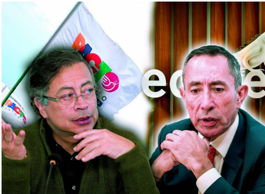
El presidente Gustavo Petro y el presidente de Ecopetrol, Ricardo Roa.

Fiscalía radicó acusación. Y se abre otro escándalo: $58.000 millones en cuentas de Roa durante la campaña de Petro en 2022. ¿Quién los puso? ¿En qué los gastaron?