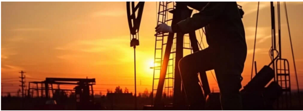
Sector petrolero y gasífero.