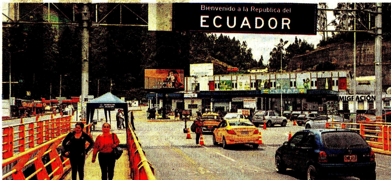
Colombia y Ecuador tienen una zona fronteriza con un flujo permanente de personas, transporte y mercancías.

El nuevo decreto de Colombia señala que la derogatoria de las restricciones ecuatorianas permitió restablecer las condiciones de acceso al mercado bilateral