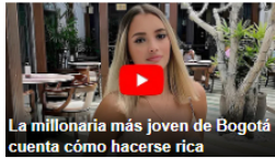
La millonaria más joven de Bogotá cuenta cómo hacerse rica