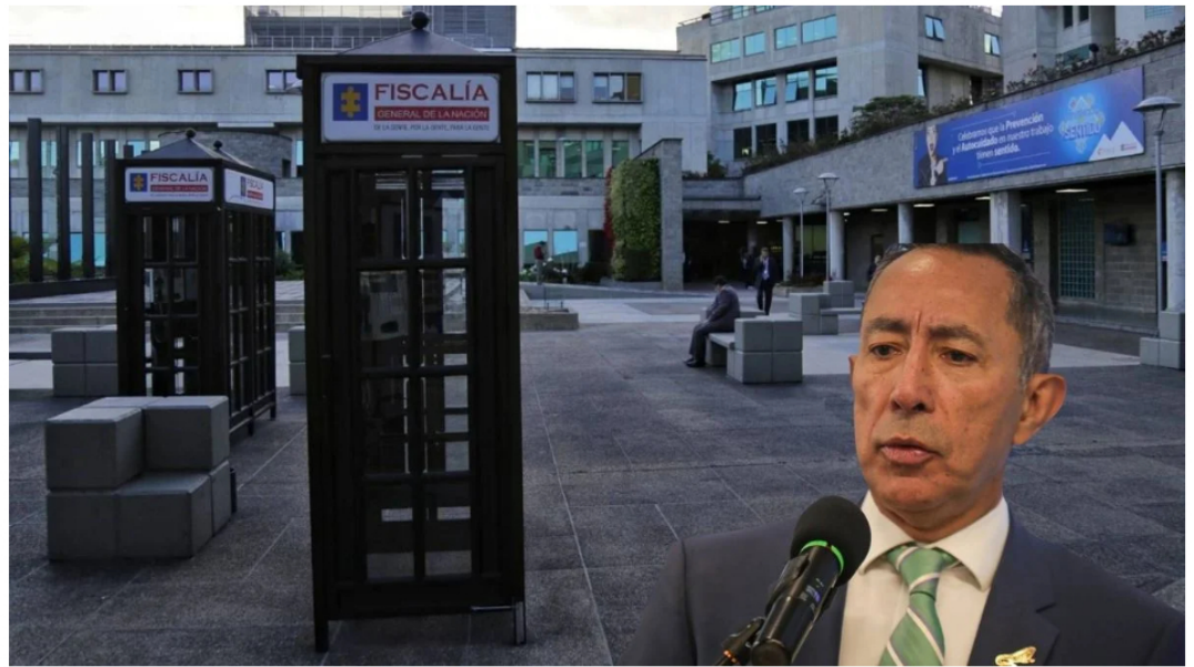
Presidente de Ecopetrol Ricardo Roa a responder en imputación de la Fiscalía General

Un fiscal de la Dirección especializada contra la Corrupción radicó escrito de acusación ante los jueces contra el presidente de Ecopetrol, Ricardo Roa Barragan , como presunto responsable del delito de tráfico de influencias de servidor público relacionado con la compra que un lujoso apartamento ubicado en el norte de Bogotá.