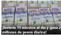
¡Invierte 15 minutos al día y gana 2 millones de pesos diarios!