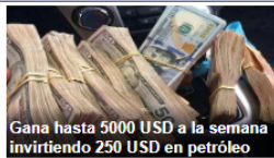
Gana hasta 5000 USD a la semana invirtiendo 250 USD en petróleo