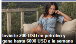
Invierte 200 USD en petróleo y gana hasta 6000 USD a la semana