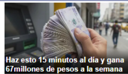
Haz esto 15 minutos al día y gana 67 millones de pesos a la semana