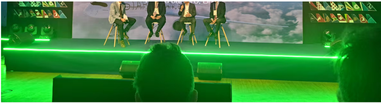
Pedro Heilbron (dcha.), CEO de Copa Airlines, durante un acto en el IATA AGM.