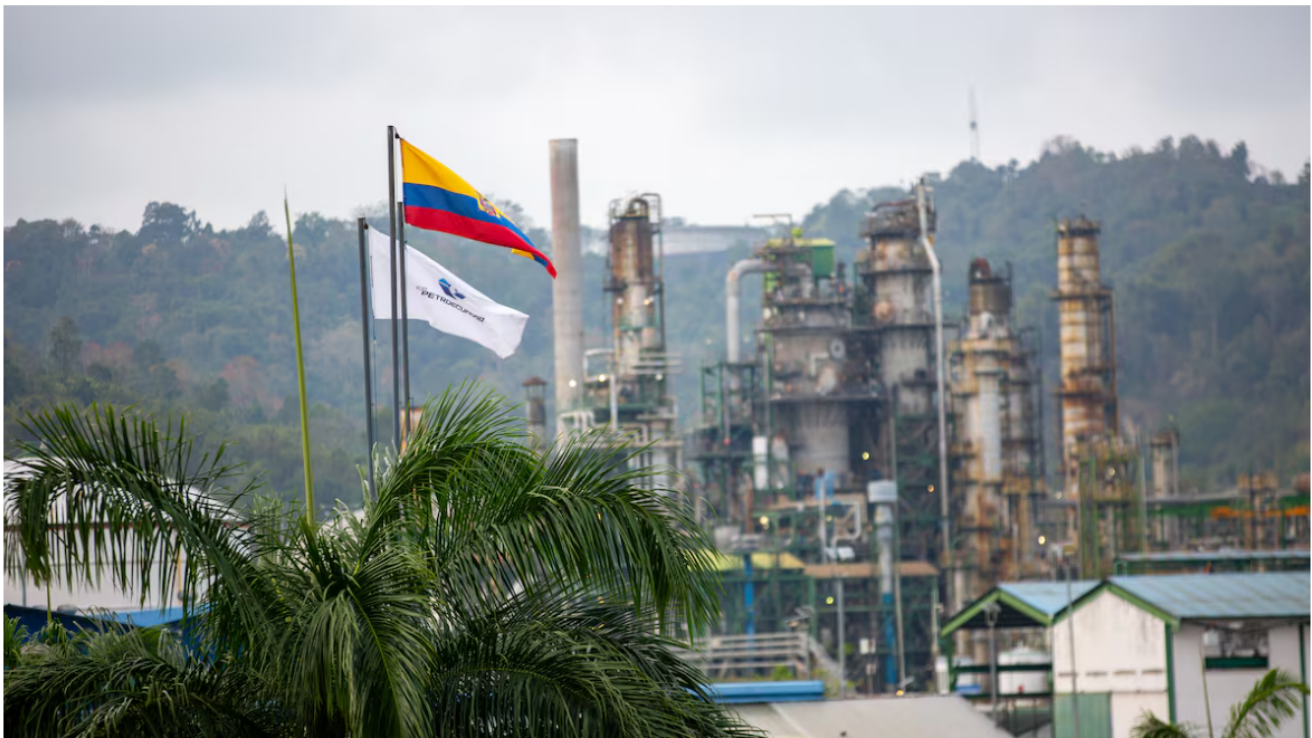
Petroecuador fue creada en el año 2010. Tres años después se separaron las funciones de exploración y explotación, que fueron asumidas por Petroamazonas. En 2019 se dispuso la fusión de ambas empresas y para el 2021 se completó ese proceso, quedando Petroecuador como una empresa pública.