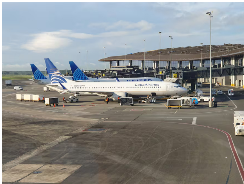
La aerolínea Copa es una de las que tienen más frecuencias internacionales en Guayaquil.

El CEO de Copa dijo a este Diario que el plan en Ecuador es seguir creciendo a medida que reciban más aeronaves . “Es un mercado importante para Copa, que sigue creciendo y a medida que recibimos más aeronaves lo seguiremos fortaleciendo”, dijo.