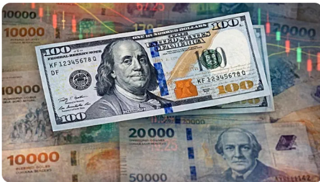
¿Por qué todos están hablando de los CFD con IA que generan ingresos? ¿Nacido entre 1956 y 1996? ¡Puedes obtener un potencial segundo ingreso!