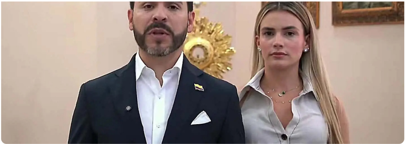
Juzgado de Bogotá acepta impedimento de jueza en tutela contra Abelardo De La Espriella por afinidades ideológicas. Así lo informó la campaña del candidato presidencial, que a su vez invitó al magistrado del CNE Álvaro Hernán Prada a hacer lo mismo por el caso AtlasIntel. El Heraldo