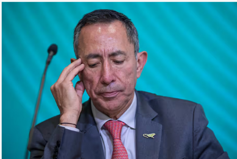
Ricardo Roa, presidente de Ecopetrol , habla antes los medios sobre investigaciones por corrupción.