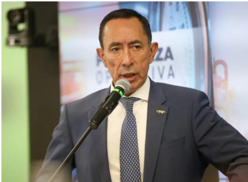
Ricardo Roa, presidente de Ecopetrol .

Durante el año electoral de 2022, por cuentas personales de Roa circularon recursos que superan en cerca de 7.000 millones de pesos los gastos reportados por la consulta interpartidista del Pacto Histórico y la campaña presidencial de Gustavo Petro.