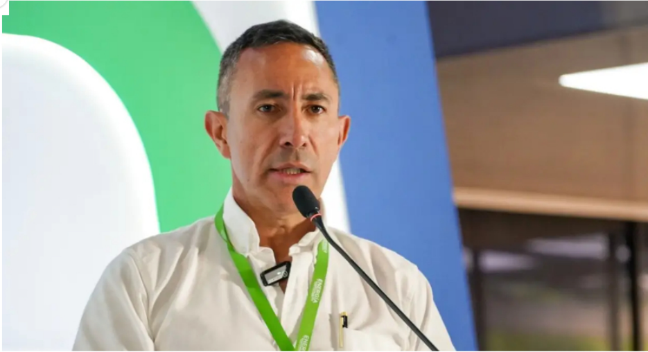
Fiscalía llama a juicio al presidente de Ecopetrol. Foto: Ricardo Roa

El caso se centra en un descuento del 34% en la compra de una propiedad en Bogotá. La entidad indaga un presunto beneficio a terceros.