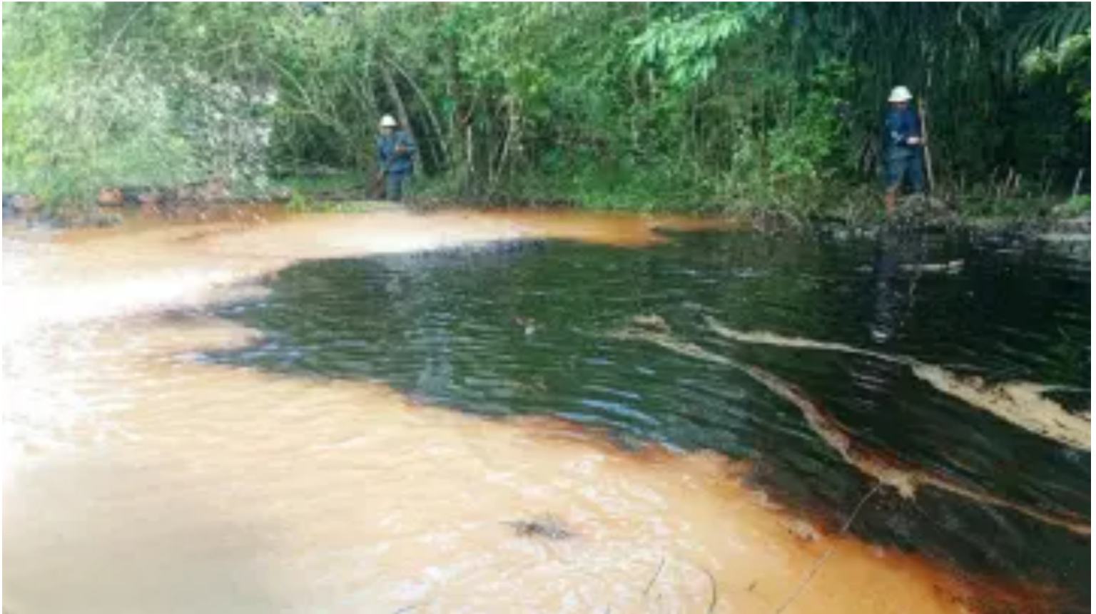
Blu Radio. Contaminación hidrocarburos corregimiento El Centro

Ecopetrol indicó que se trata de un afloramiento natural. En la zona, operarios realizan labores de contención y limpieza de la quebrada.