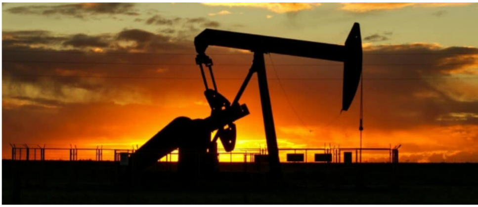
Producción de petróleo.

También expresó que el declive de los campos de gas plantea la necesidad de realizar nuevos descubrimientos, es decir, de fortalecer la exploración para que estos recursos puedan entrar a abastecer el mercado en el corto plazo y, de esa manera, disminuir la brecha entre oferta y demanda.