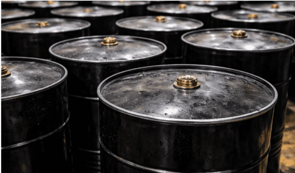
Barriles de petróleo. Imagen: Generada por inteligencia artificial

A lo anterior se añade que la compañía incorporó 300 millones de barriles de petróleo a sus reservas probadas, lo que para la Asociación Colombiana de Ingenieros de Petróleos (Acipet) representó un resultado positivo.