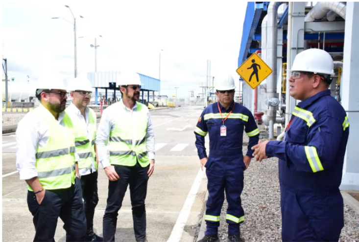
El ministro de Minas y Energía, Edwin Palma, visitó las instalaciones del antiguo puerto Impala en Barrancabermeja, el cual reanudará operaciones desde el próximo 1 de julio bajo el nombre de Puerto Voluntad.

Compartir Publicado por: Lesly Adriana Cifuentes